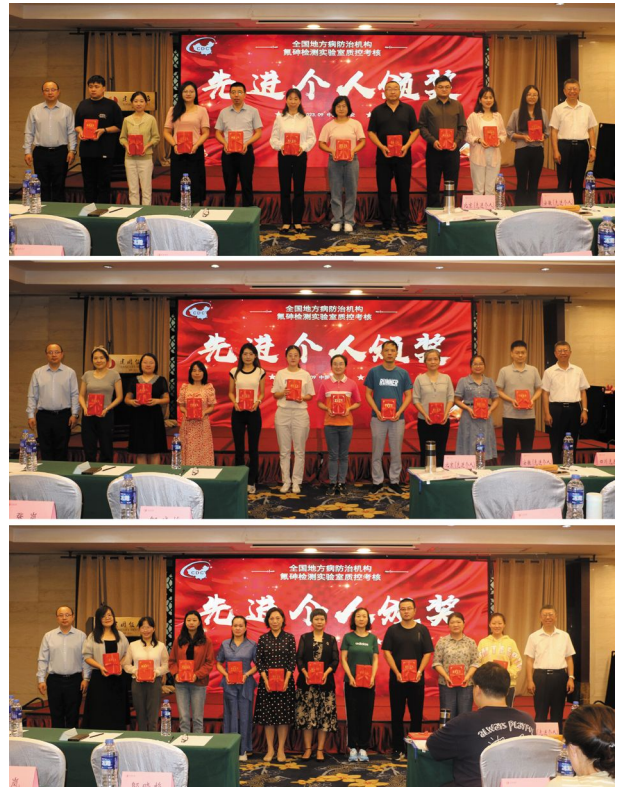
为先进个人代表颁发证书