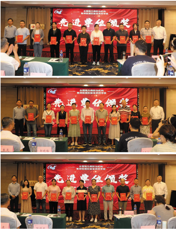
为先进单位代表颁发证书