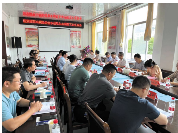
调研组在合水县疾控中心与当地工作人员进行座谈

治相关资料和深入交流，了解当地防治队伍的变化、克山病防治工作的进展及病情现状。孙树秋指出，作为国家级克山病联系点，在做好每年克山病监测及病人治疗工作基础上，应进一步分析个体用药方案与治疗效果的相关性、建立治疗病例人群动态变化队列、并根据监测数据重点揭示新发病人产生的原因等情况。