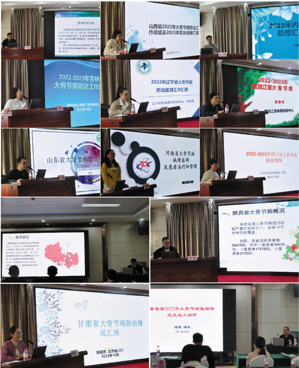
与会专家和各省代表们进行经验交流

节病防治的卫生经济学等方面能力的提升起到了重要作用,为持续推进大骨节病控制和消除评价工作、实现消除大骨节病的目标提供了技术支撑。