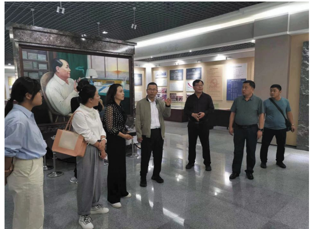
泾川县一行参观中国地方病防治史展