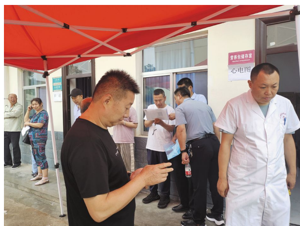
调研组深入泾川县王村中心卫生院对克山病治疗项目患者进行现场调查

7月12日-13日，调研组一行深入泾川县王村中心卫生院和县中医院。在当地专业人员的配合