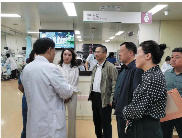
泾川县一行赴哈尔滨医科大学附属第二医院心血管病医院学习交流